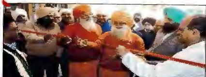
निमित आश्रम होस्टल में तीन दिवसीय निराहण दिव्यांग शिविर का शुभारंभ