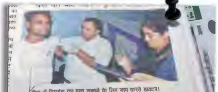
कैप में दिव्यांगों का हाथ तन्हाने के लिए नाम करते छात्ररत।