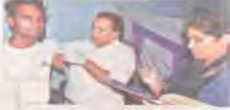
केप में दिव्यांग का हस्त रखने के लिए भाग करती हस्तार...